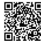
駅からのアクセス方法