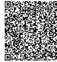
静岡県立大学 草薙キャンパス